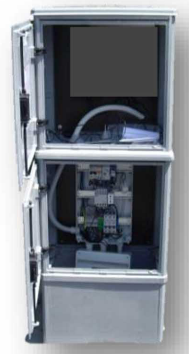
QUADRO ELETTRICO ESISTENTE O DI NUOVA INSTALLAZIONE