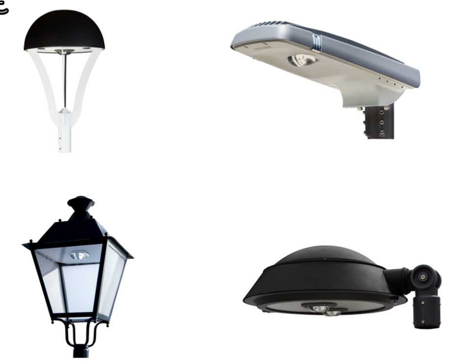
TELECONTROLLO CON REGOLAZIONE DA QUADRO CON REGOLAZIONE DEL FLUSSO IN TEMPO REALE