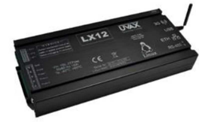
CONCENTRATORE INSTALLATO IN OGNI QUADRO